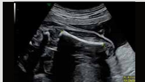
Автоматическое измерение длины бедра с помощью технологии Sonobiometry

Инструменты автоматизации Voluson упрощают рабочий процесс и способствуют воспроизводимости измерений.